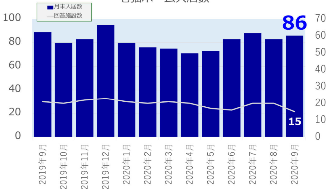
老猫ホーム入居数