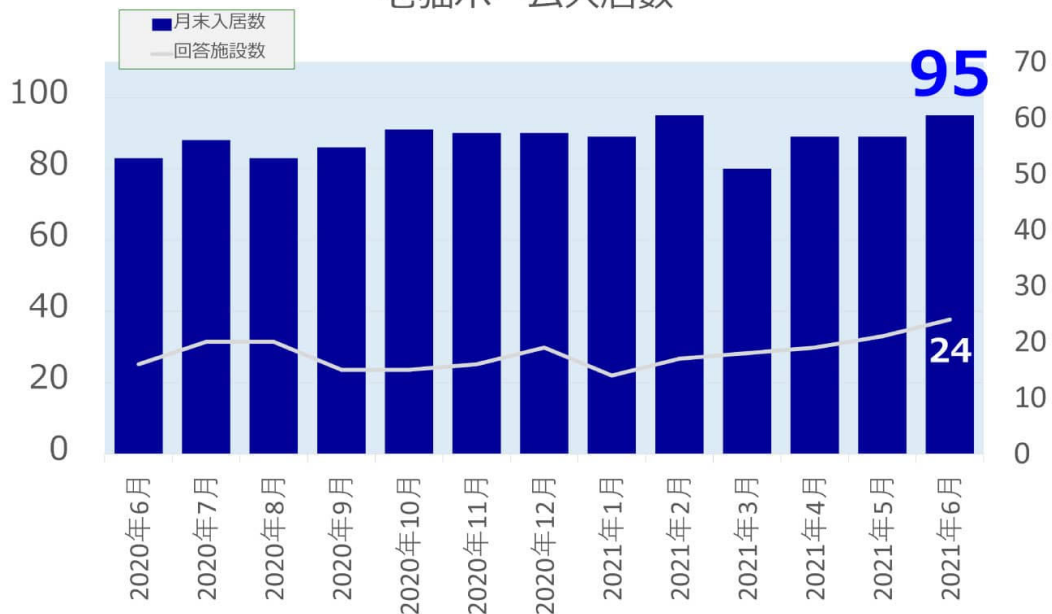
老猫ホーム入居数